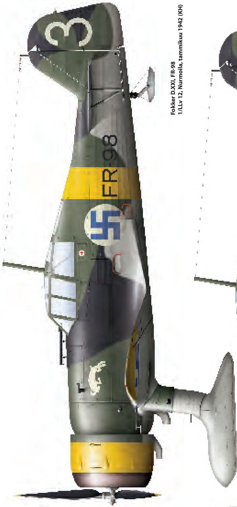
Fokker D.XXI, FR-98 1/LLv 12, Nurmoila, tammikuu 1942 (KH)