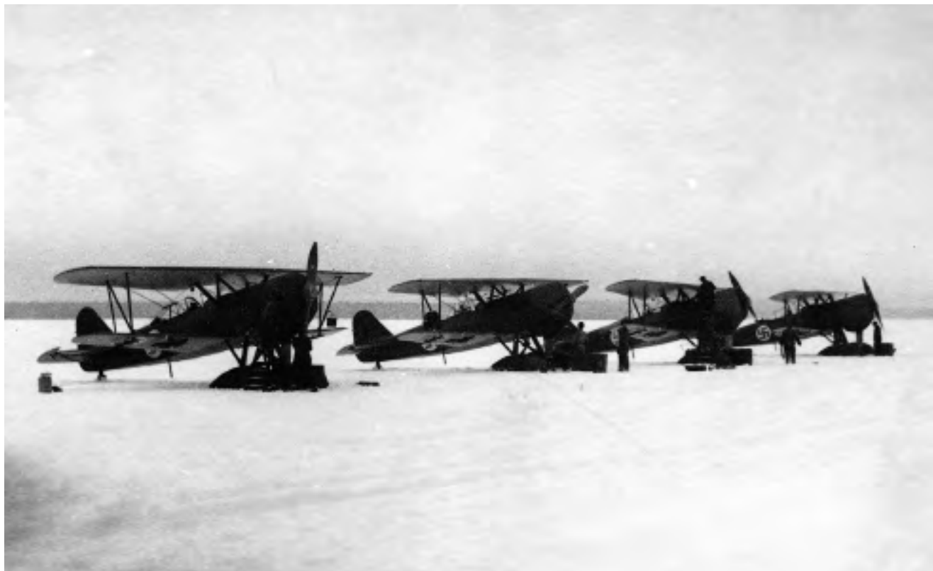
3/LLv 12:n Fokkerit Suur-Merijokela joulukuun alussa 1939. Koneet ovat FK-99, 100, 101 ja 105. Lentueen päällikkönä oli luutnantti Aulis Bremer.