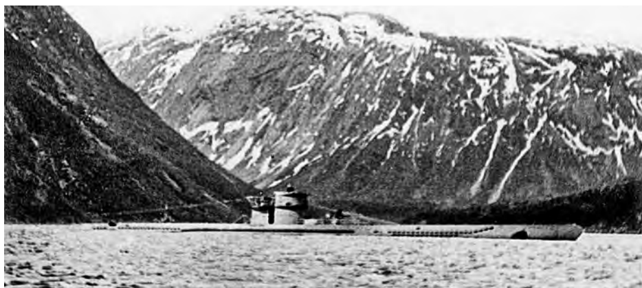
Sukellusvene Narvikin edustalla.

Poikkeuksellinen mallin VI komentotorni, jossa tornin eteen oli asennettu 37-millinen M42-ilmatorjuntatykki. Tämä sukellusvene palveli Jäämerellä ennen siirtoa Saint-Nazaireen vuonna 1944.