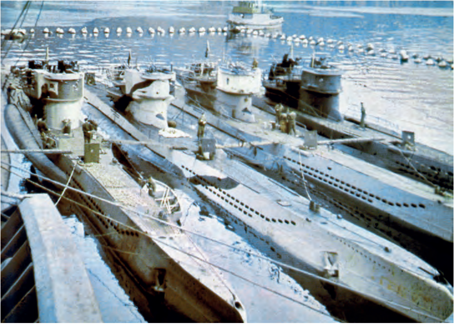
(Vasemmalta oikealle) U-365 , U-362 , U-711 , U-278 ja U-997 varikkoalus Black Watchin rinnalla Hammerfestissä heinäkuussa 1944.