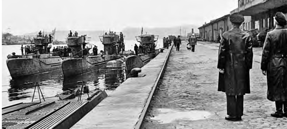
Sukellusveneitä Trondheimissa vuonna 1945.