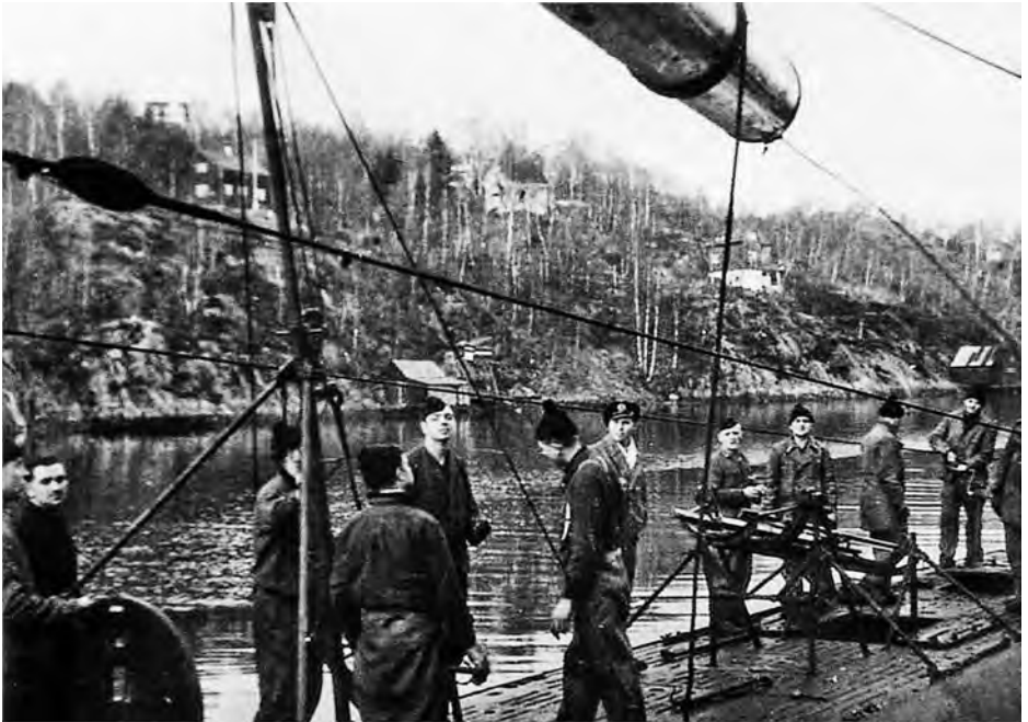
U-622:een lastataan torpedoja Askøyn torpedovarikolla lähellä Bergeniä.