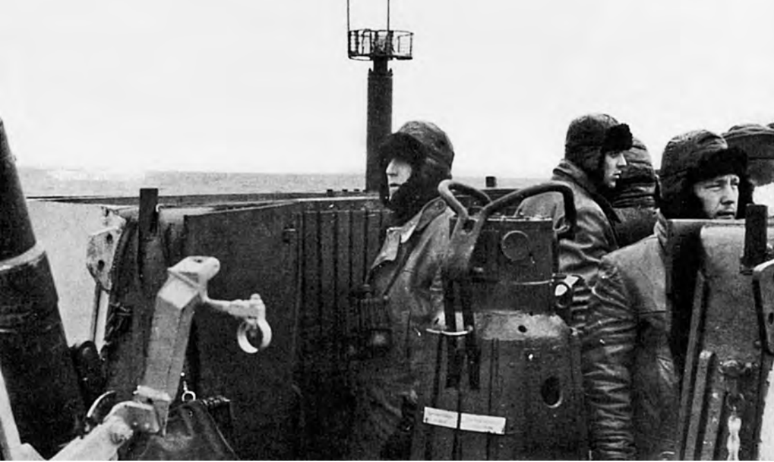
Tyypin VIIC sukellusvene partioi Jäämerellä tyynessä säässä. Taivaanrannassa Naxos-tutkanpaljastimen vasemmalla puolella siintää jäävuori.