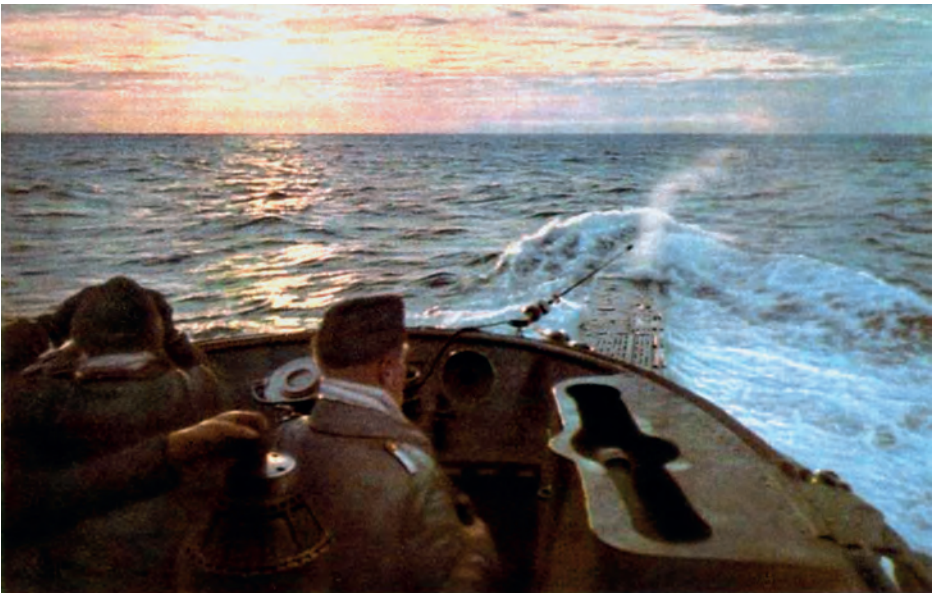
Iltahämärä merellä: Die Kriegsmarine -lehden propagandakuva, jossa näytetään Jäämeren sukellusvenepartioiden parempaa puolta.