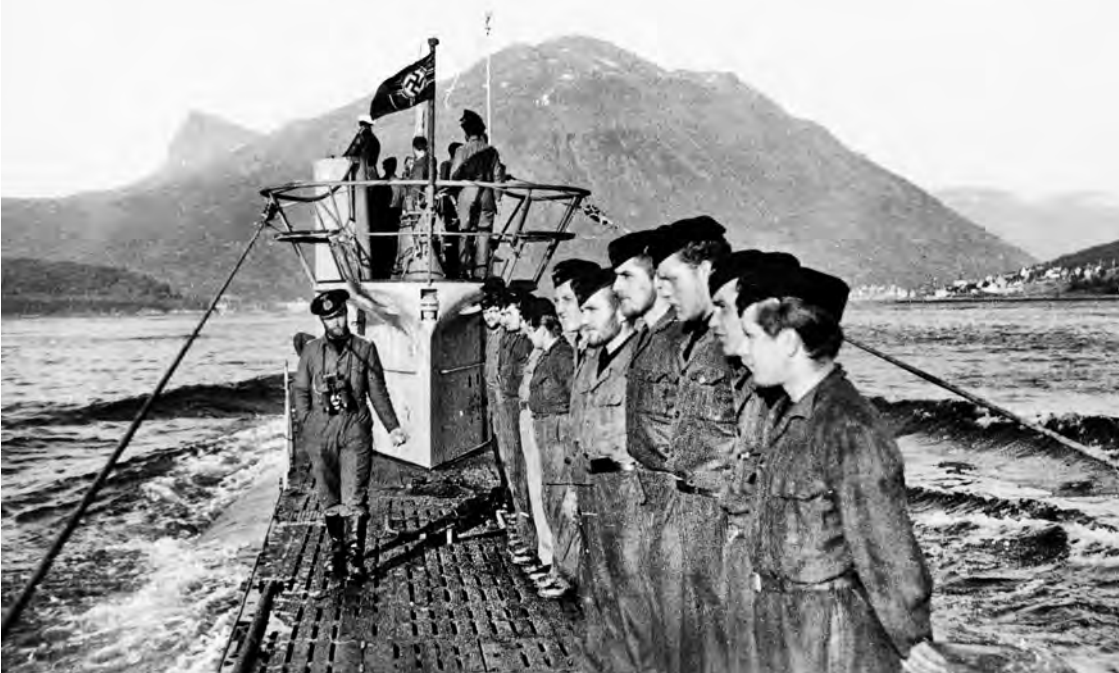
Tyytin VIIC sukellusvene lähestyy Narvikia.