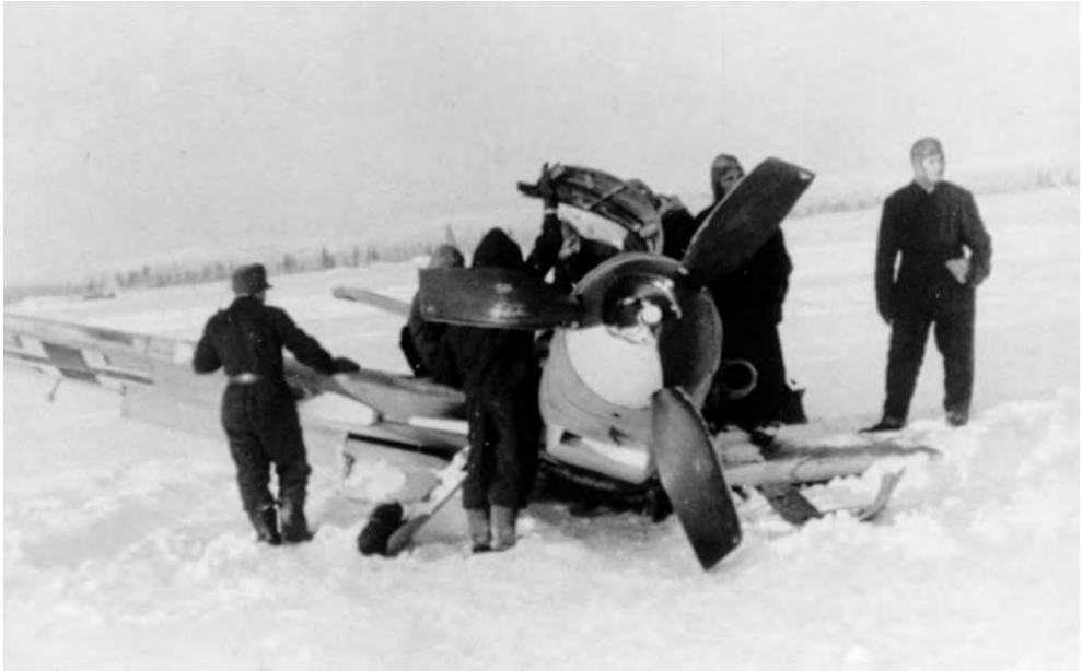
Tällainen lumimäärä aiheutti jatkuvia ongelmia nousuissa ja laskuissa. Keltaista 1:stä valmistellaan siirtoon Alakurtissa.