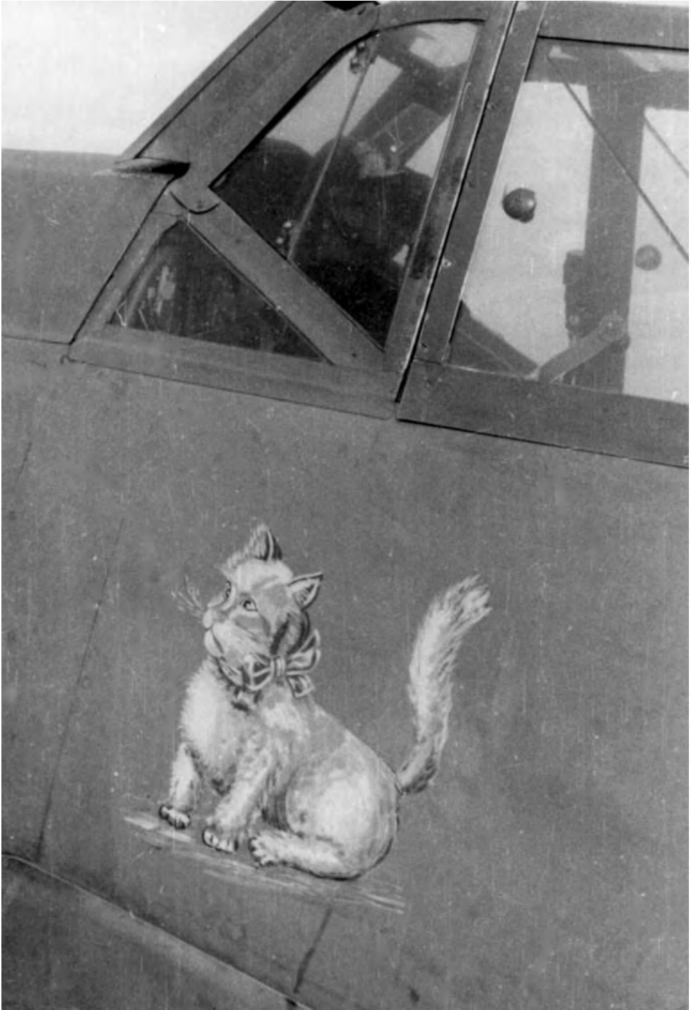
Rudi Müllerin keltaisen 3:n ohjaamon alla näkyy hänen henkilökohtainen tunnuksensa kissa.