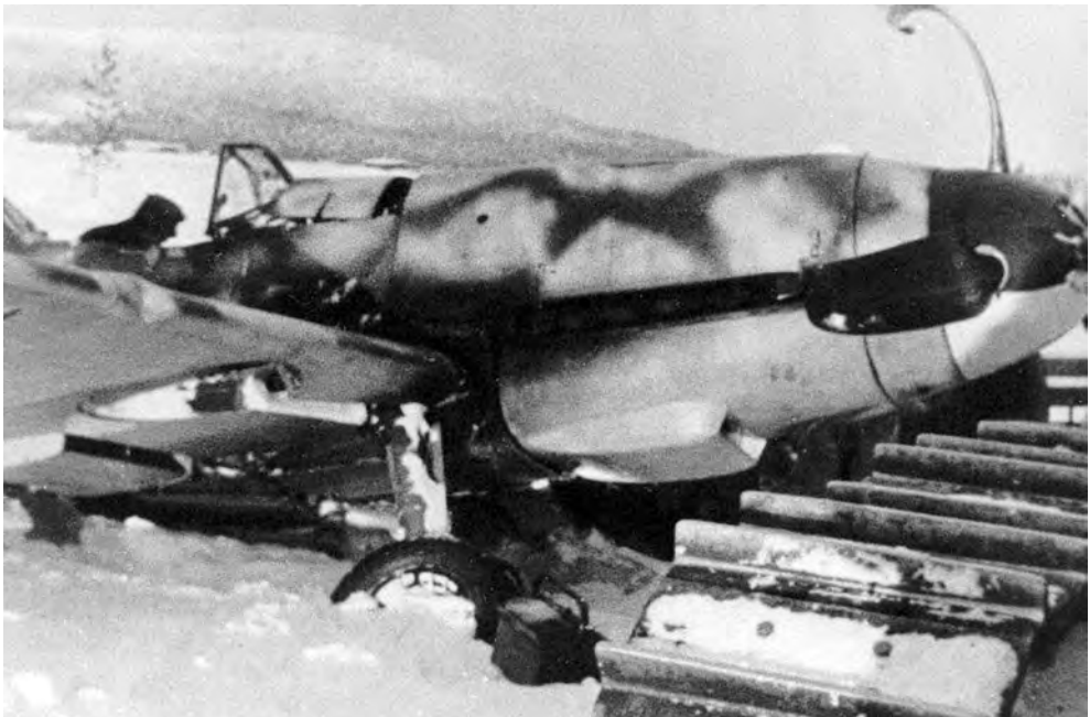
Keltaista 1:stä vedetään pois korjattavaksi. Hinausajoneuvo on jo tullut paikalle. Tässä samoin kuin ylempänä olevassa kuvassa näkyy selvästi 6. lentueen koneiden talvimaalaus.