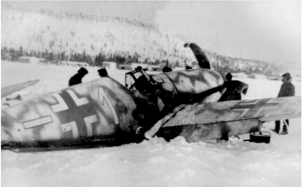
6. lentueen keltainen 1, eräs viimeisistä Bf 109 F-4 -tyypin koneista lentueessa, on mennyt startissa mahalleen Alakurtissa, todennäköisesti helmikuussa 1943.