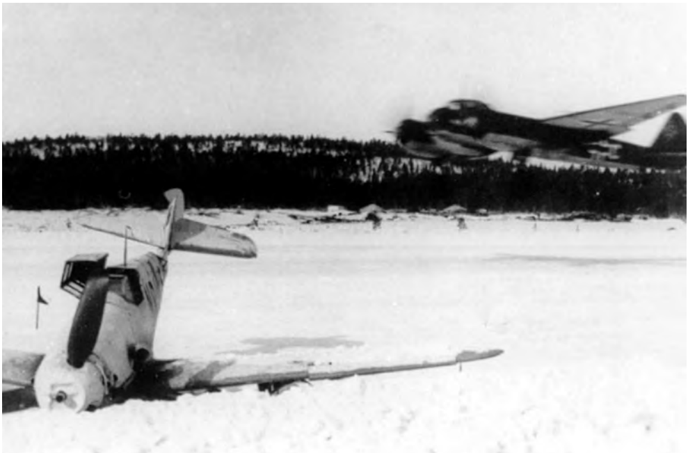
Etualalla 6. lentueen Bf 109 G-2 mahalaskun jälkeen. Taustalla 5. ilma-armeijan tiedusteluparven Junkers Ju 88 on juuri nousussa Alakurtista.