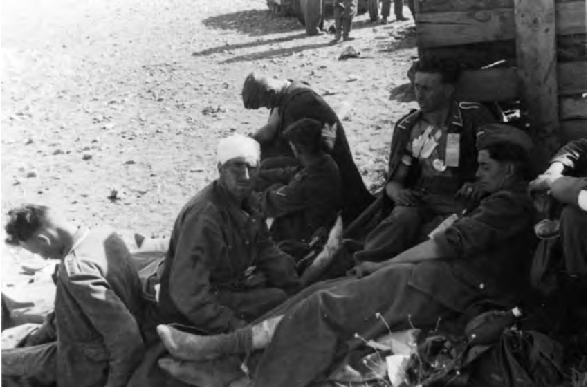
Saksalaisia haavoittuneita Kreetan taistelussa. Saksalaisten taistelukertomusten mukaan saaren tappioiksi arvioitiin 4000–6500 miestä, joista kaksi kolmasosaa oli kaatuneita.

tenkin haltuun lännestä ja etelästä käsin. Vain kentän itäosa tuotti vaikeuksia, sillä britit pystyivät edelleen tulittamaan sitä siitä suunnasta konekivääreillä ja tykeillä. Oli pakko aloittaa sieltä, missä voitto oli helpoimmin saavutettavissa.” 49