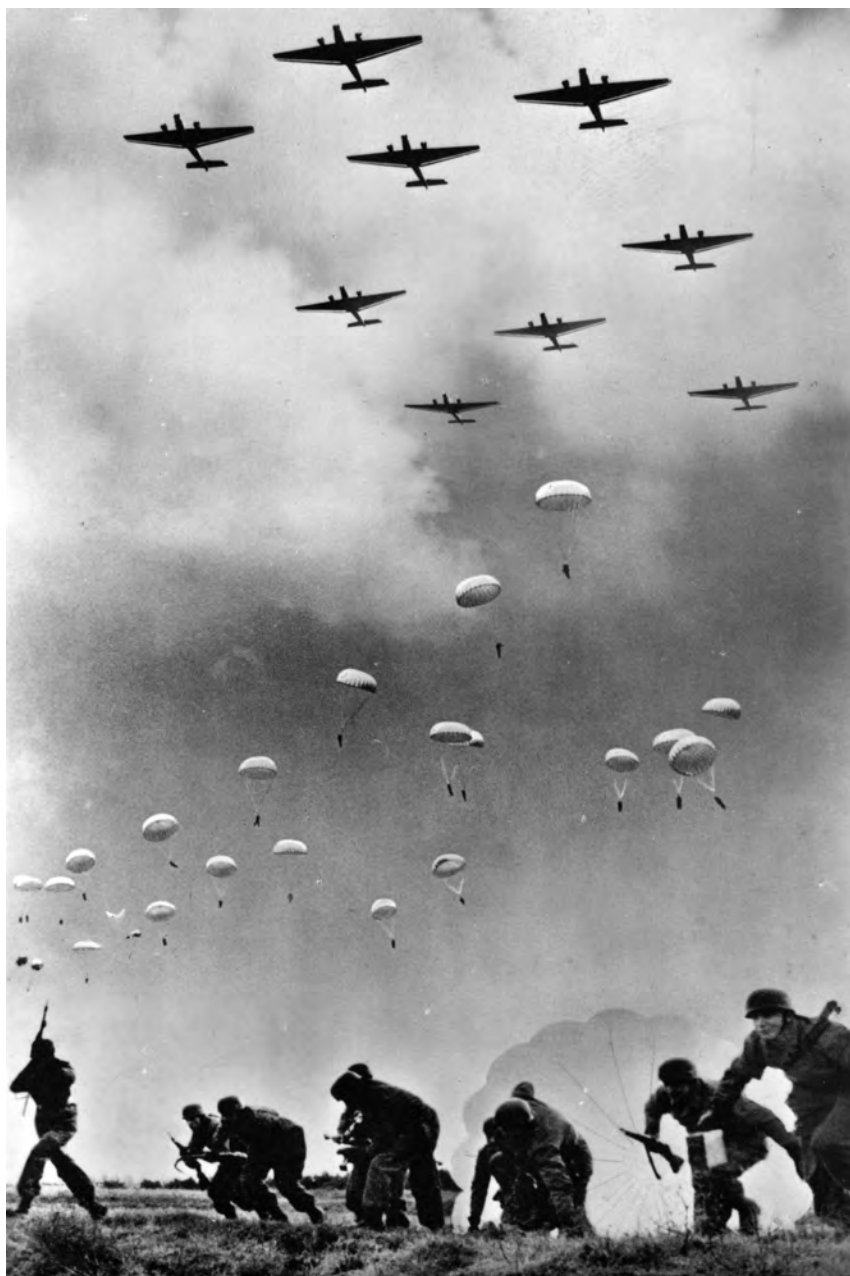
Saksalaisessa propagandakuvassa esiintyy laskuvarjojääkäreitä varjojen varassa ja maan kamaralla aseet tanassa. Taivaalla erottuu Luftwaffen Ju 52 -koneita, jotka olivat Hitlerin maahanlaskujoukkojen työjuhtia.