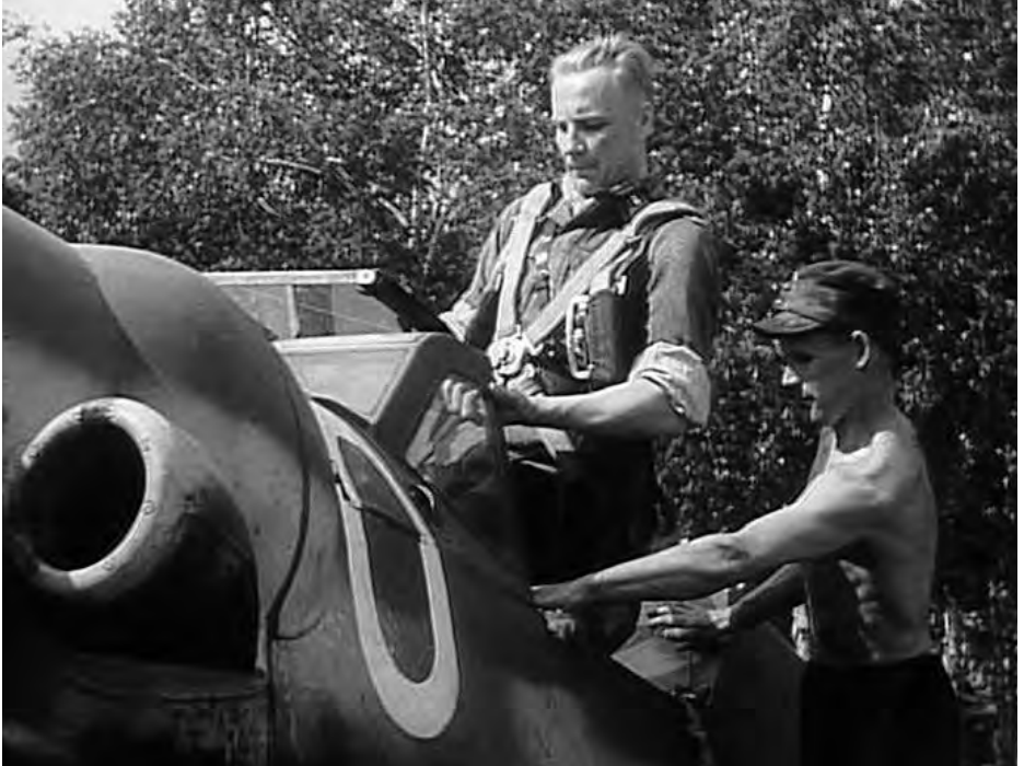
Edellisenä päivänä toisen kerran Mannerheim-ristin ritariksi nimitetty Illu Juutilainen lähdössä MT-451:llä torjuntalennolle 29.6.1944 Lappeenrannasta, jonne Illu oli lentänyt varta vasten filmausta varten.