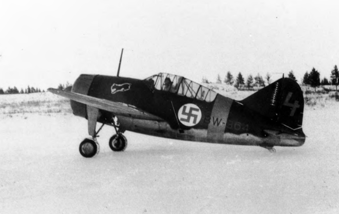
Illu Juutilainen starttaa BW-364:llä Solomannista 18.12.1941 lyhyelle siirtolennolle Kontupohjaan jäätukikohtaan.